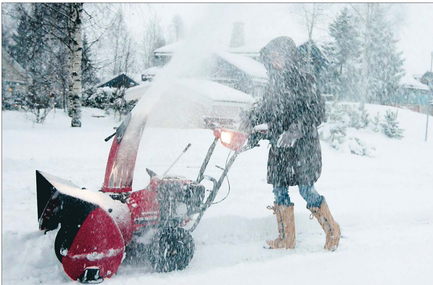
Enkelte mener brøyteberedskapen av E 134 er en smule underdimensjonert.

BILDET ER IKKE MANIPULERT FORDI MANIPULATOREN ER NEDSNØDD