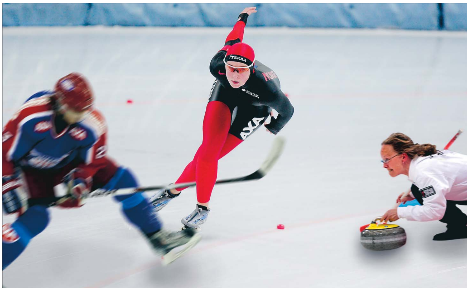
Leksigalt-redaksjonen setter pris på Skøyteforbundets bestrebelsel for å gjøre sporten mer interessant.